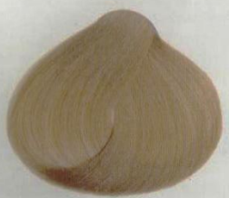
88 BIONDISSIMO INTENSO ЭКСТРА СВЕТЛО-РУСЫЙ