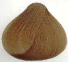
76 BIONDO AMBRA ЯНТАРНО-РУСЫЙ