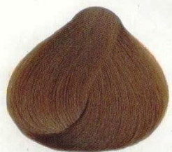
77 BIONDO SCURO DORATO ТЕМНО-РУСЫЙ ЗОЛОТИСТЫЙ