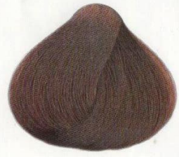
08 | CASTANO MOGANO МАХАГОН