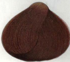
75 CASTANO DORATO ЗОЛОТИСТЫЙ КАШТАН