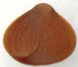
86 BIONDO ARANCIO INTENSO АПЕЛЬСИНОВО-РУСЫЙ