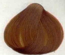
20 ROSSO TIZIANO ТИЦИАН