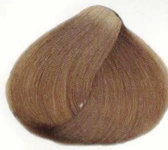
09 | BIONDO NATURALE РУСЫЙ