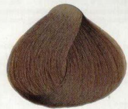
84 BIONDO SCURO ТЕМНО-РУСЫЙ