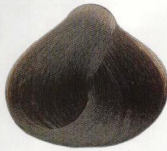
06 | CASTANO SCURO ТЕМНО-КАШТАНОВЫЙ