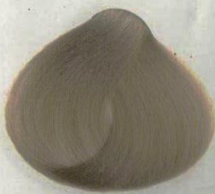
13 BIONDO SVEDESE ШВЕДСКИЙ БЛОНДИН