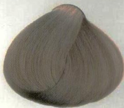
15 BIONDO GENERE ПЕПЕЛЬНО-РУСЫЙ