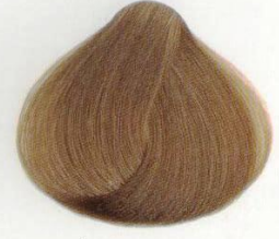
12 | BIONDO DORATO ЗОЛОТИСТО-РУСЫЙ