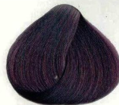
21 MIRTILLO ЧЕРНИКА