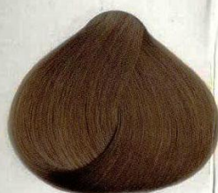
14 BIONDO SCURO ТЕМНО-РУСЫЙ