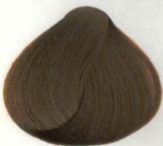
27 BIONDO AVANA ГАВАНА БЛОНД