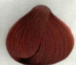
24 CILIEGIA КРАСНАЯ ВИШНЯ