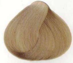
10 | BIONDO CHIARO СВЕТЛО-РУСЫЙ