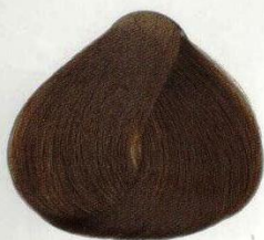
74 CASTANO CHIARO СВЕТЛЫЙ КАШТАН