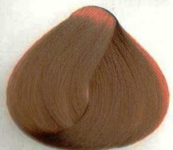
16 BIONDO RAMATO МЕДНО-РУСЫЙ