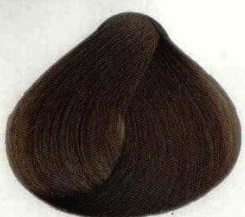
18 VISONE НОРКОВЫЙ