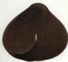
26 ТАБАССО ТАБАК