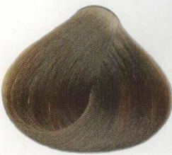
05 | CASTANO DORATO ЗОЛОТИСТО-КАШТАНОВЫЙ