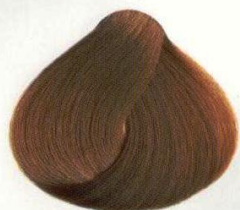
30 BIONDO CALDO SCURO ТЕМНО-РУССКИЙ ТЕПЛЫЙ