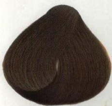
25 МОКА МОККО