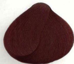
28 CASTANO ROSSO КРАСНЫЙ КАШТАН