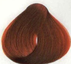
29 BIONDO SCURO RAME ТЕМНО-РУССКИЙ МЕДНЫЙ