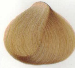
11 | BIONDO MIELE МЕДОВЫЙ БЛОНДИН