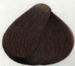
73 CASTANO NATURALE НАТУРАЛЬНЫЙ КАШТАН