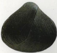
01 | NERO ЧЕРНЫЙ