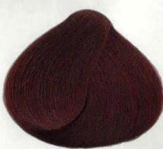
78 MOGANO МАХАГОН