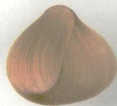
87 BIONDISSIMO DORATO ЭКСТРА СВЕТЛЫЙ ЗОЛОТИСТЫЙ БЛОНДИН