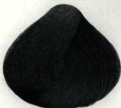
17 NERO BLU СИНЕ-ЧЕРНЫЙ