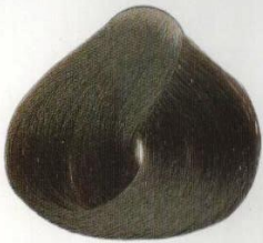
03 | CASTANO NATURALE КАШТАНОВЫЙ