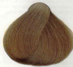
79 BIONDO NATURALE НАТУРАЛЬНЫЙ РУСЫЙ