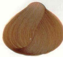
85 BIONDO RAME VENEZIANO МЕДНО-РУСЫЙ ВЕНЕЦИЯ