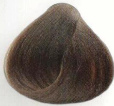
04 | CASTANO CHIARO СВЕТЛО-КАШТАНОВЫЙ