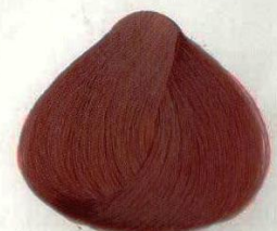
22 FRUTTI DI BOSCO ЛЕСНАЯ ЯГОДА