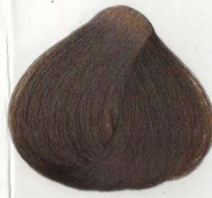
07 | CASTANO CENERE ПЕПЕЛЬНО-КАШТАНОВЫЙ