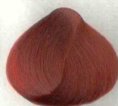
23 RIBES ROSSO КРАСНАЯ СМОРОДИНА